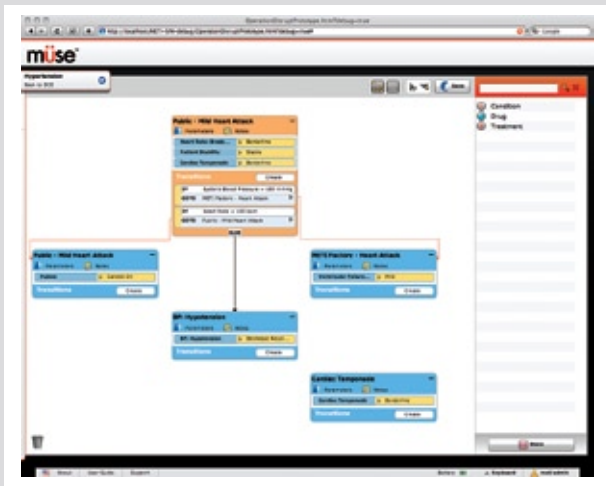
EDITOR DE ESCENARIOS: arrastra y suelta condiciones, fármacos y tratamientos para cumplir con tus objetivos de entrenamiento.